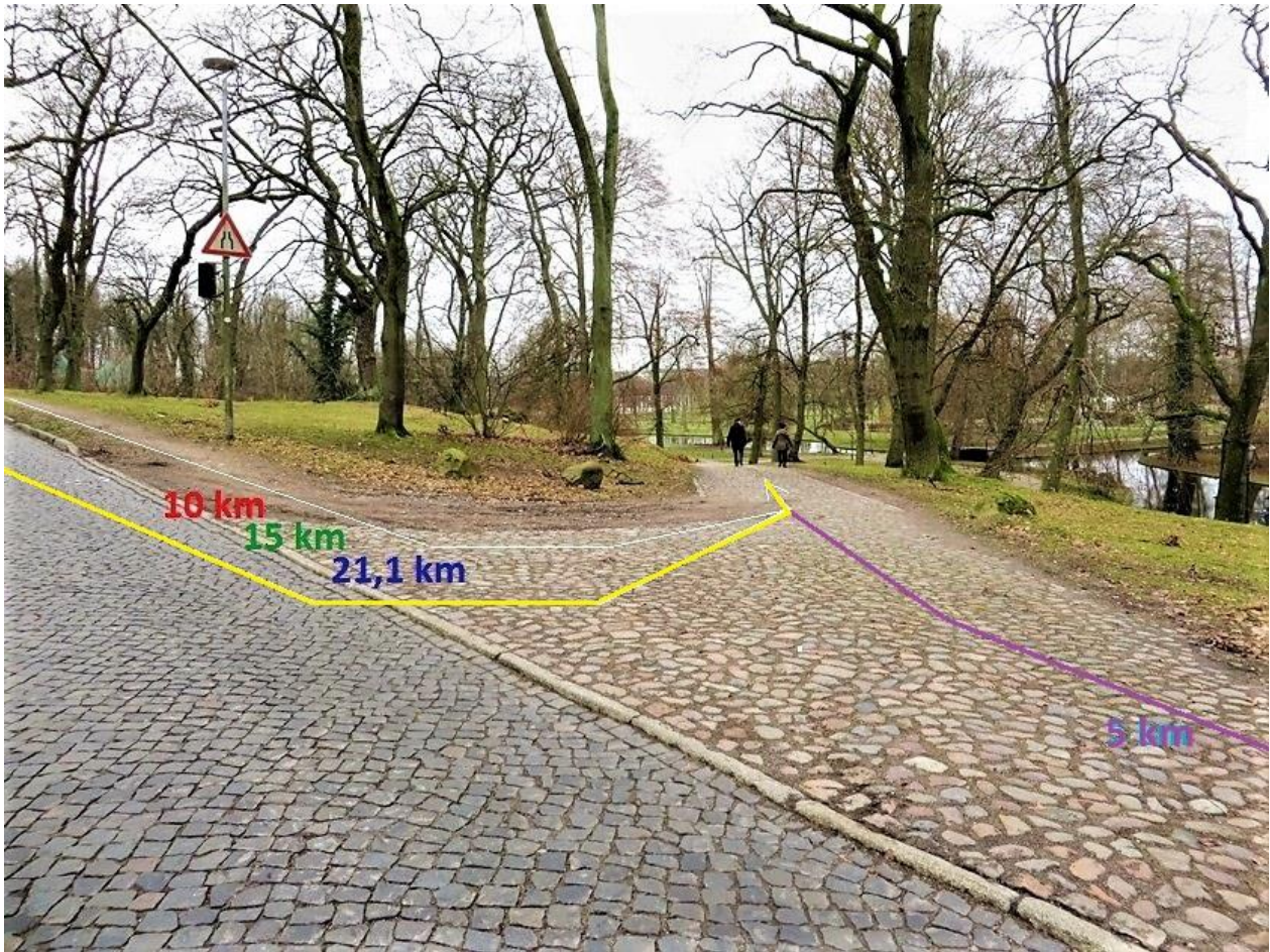
„Schleifmühlenweg“ Einbiegung auf Pflasterweg in den Schlossgarten

(hier Zusammenführung aller Streckenlängen!)