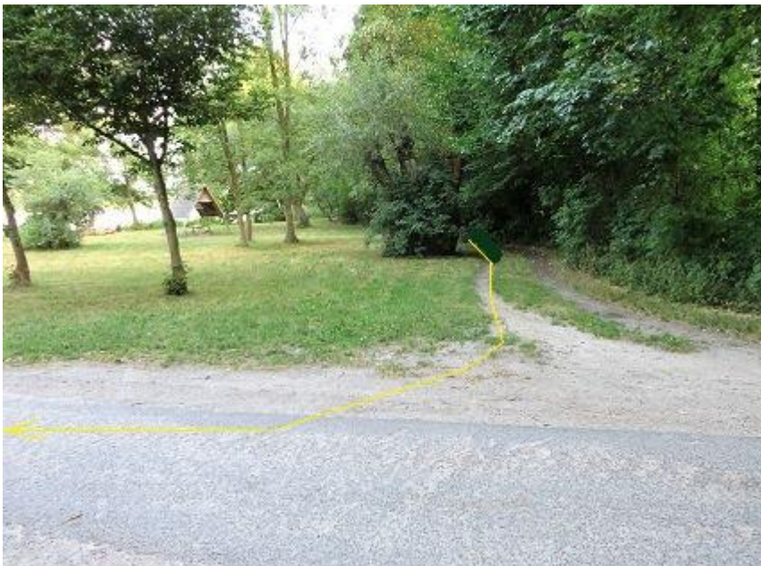
Einbiegung auf „Hexenberg“