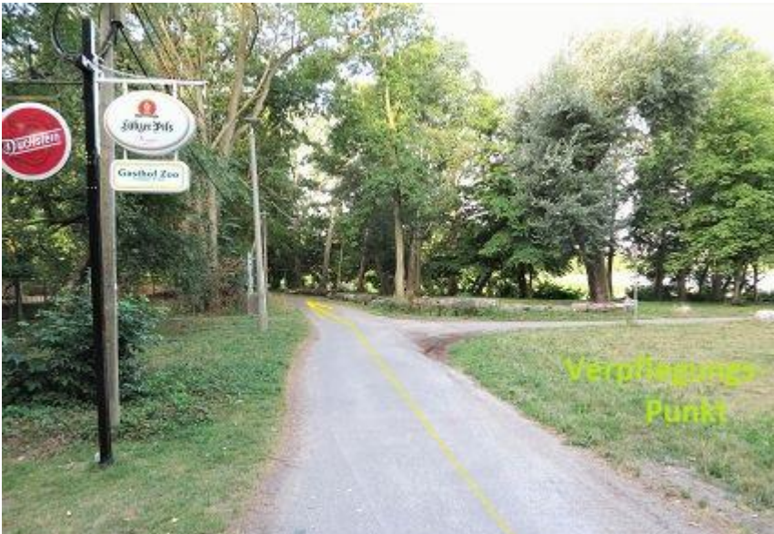
„Gasthof Zoo“ am Hexenberg