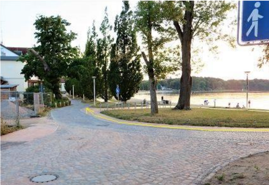
„Am Strand“ - Fahrweg