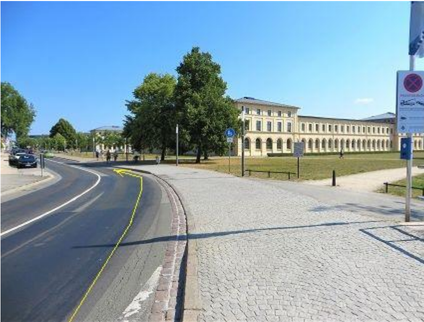
Werderstraße - rechts Marstallgebäude