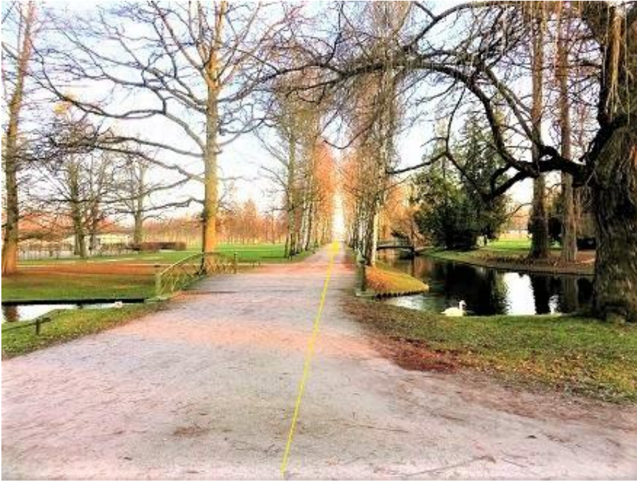
Brücke über Kreuzkanal zum Birkenweg