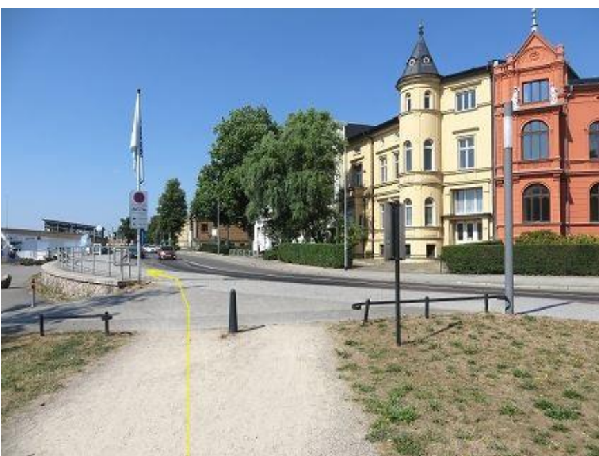
Abbiegung in Werderstraße - zur Schlossbrücke