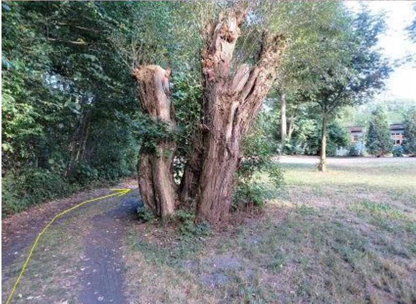
Rastplatz-Dreieck bei Zoogaststätte