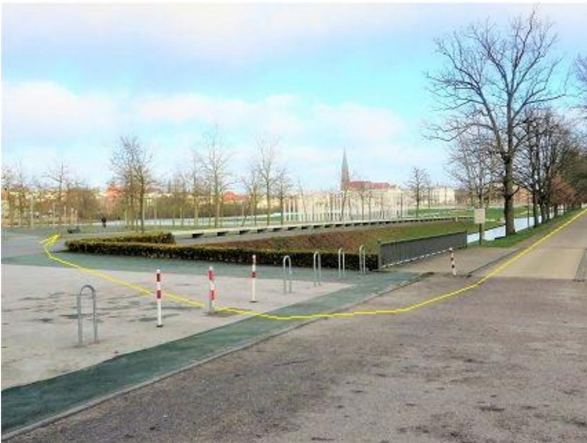
Burgseestraße - Bertha-Klingberg-Platz