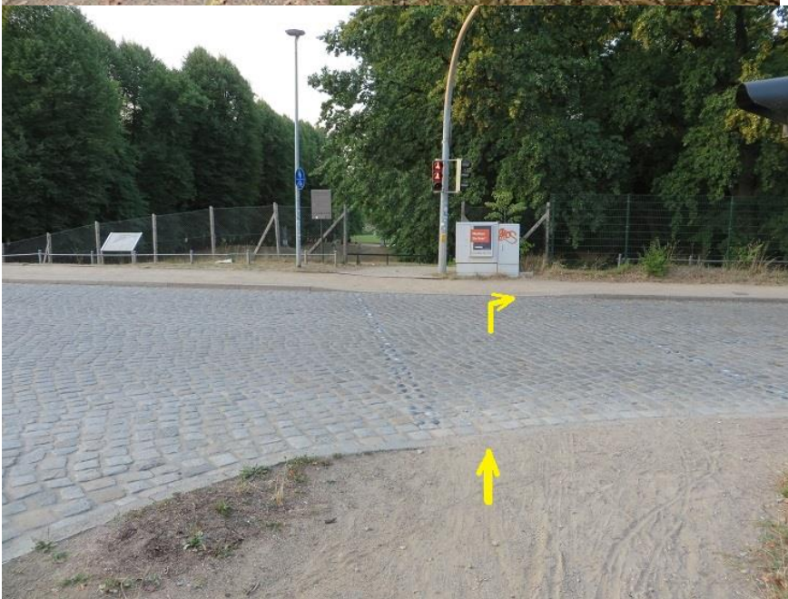
Johannes-Stelling- Straße -

Querung Schleifmühlenweg - Höhe Eingang Freilichtbühne