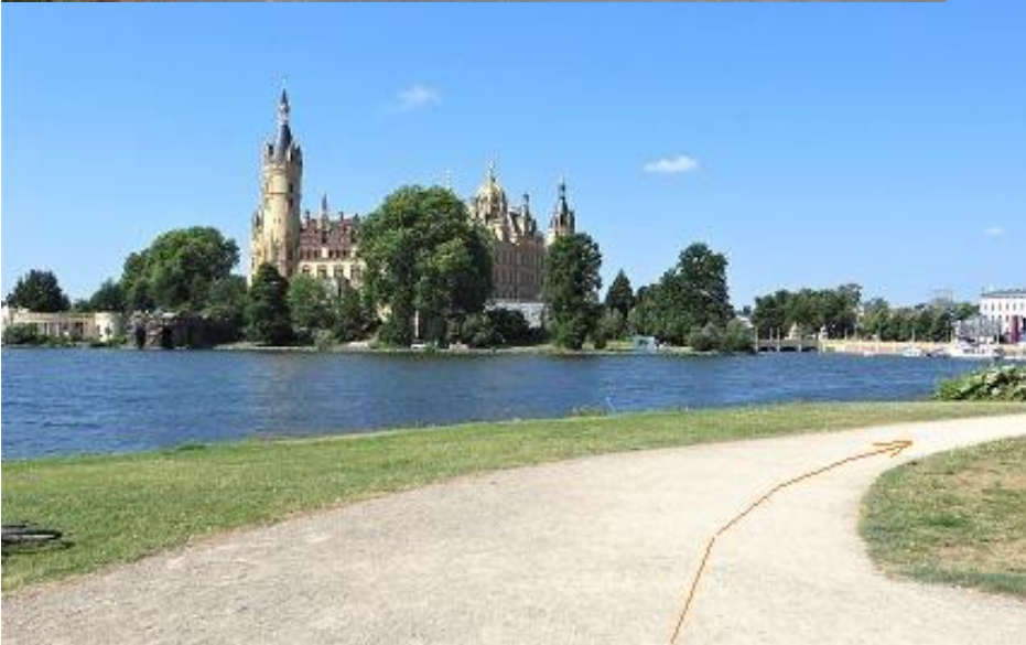
Schlossblick von Marstallhalbinsel