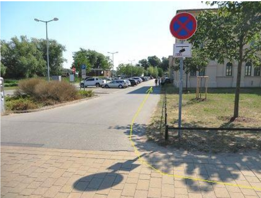
Werderstraße - Abbiegung zur Marstallhalbinsel