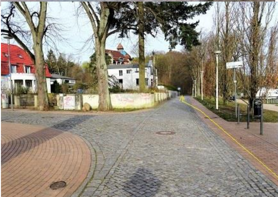
„Am Strand“ - Fahrweg