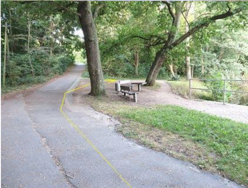
Abbiegung zur Südseite Fauler See

(Hier Absperrung – es muss um die Eiche rumgelaufen werden!)