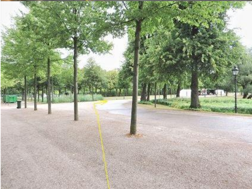
Lennéstraße - Schlossgarten