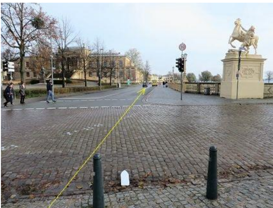
Querung Schloßstraße zur Werderstraße