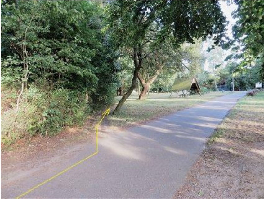
„Schleifmühlenweg“ - Fauler See

Anfang Rastplatz-Dreieck (Nähe Zoo-Gaststätte)