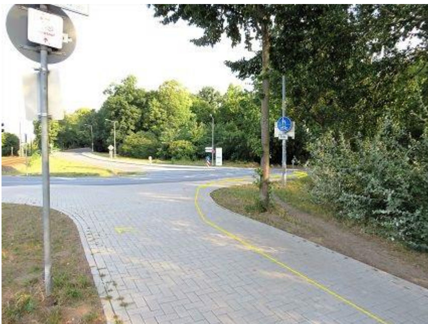
Fauler See - Anfang Lennéstraße