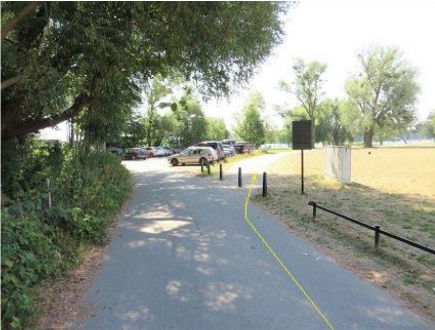
Abbiegung vor Seglerheim zur Marstallhalbinsel-Passage