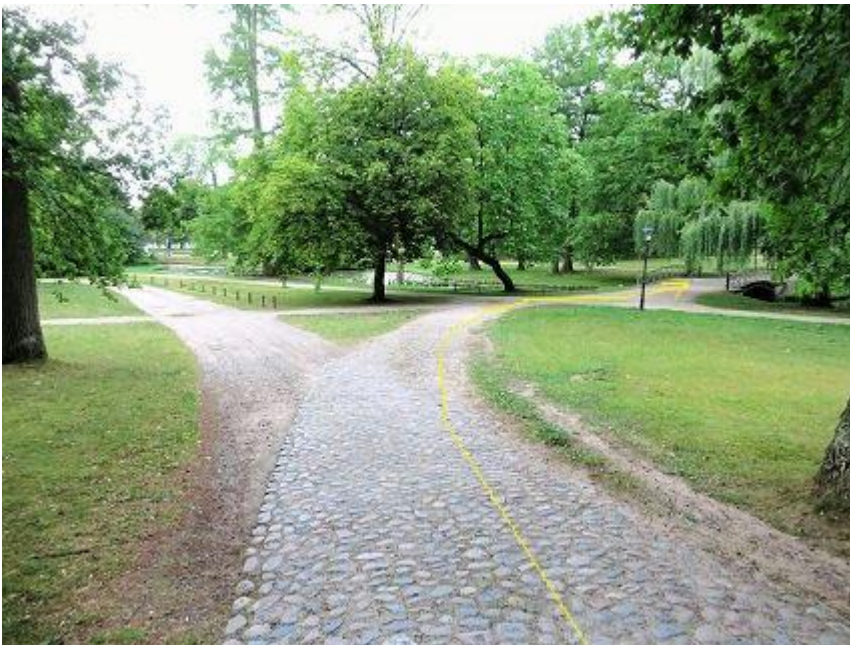
Schlossgarten – Pflasterweg zum Kreuzkanal