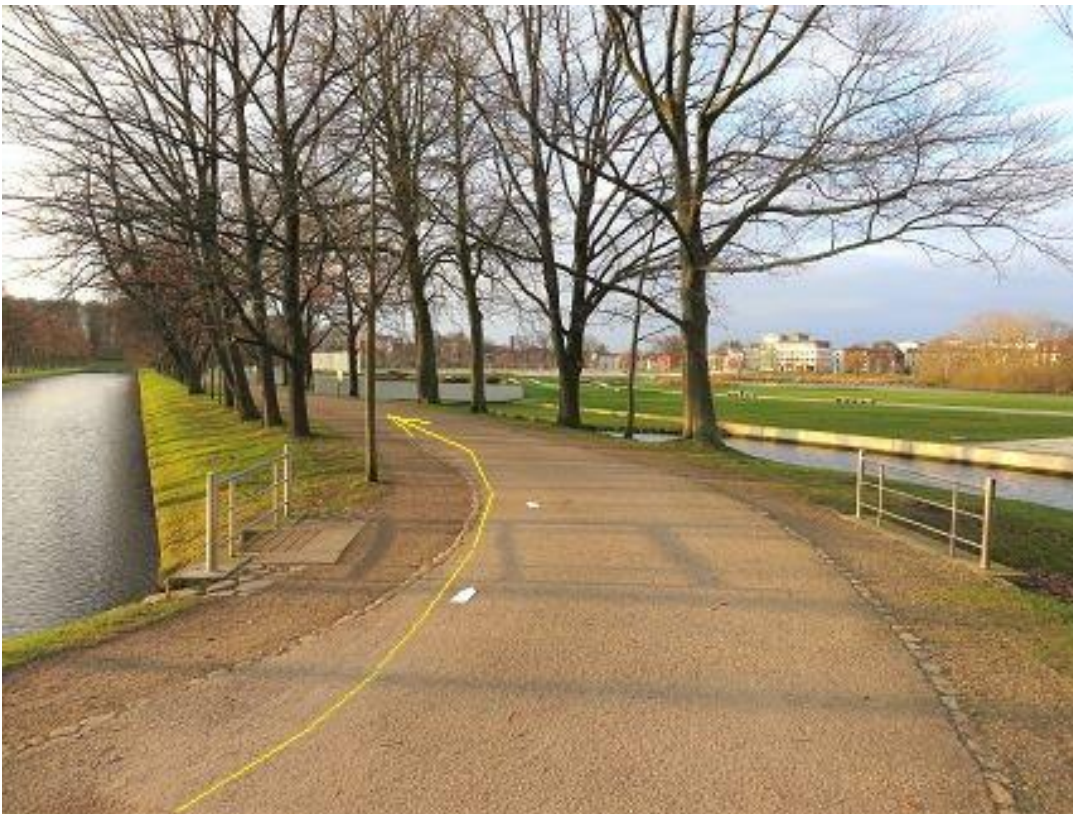
Burgseestraße - mit Blick auf die „Schwimmende Wiese“.