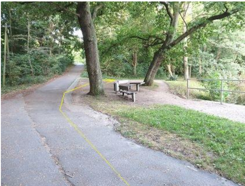
Abbiegung zur Südseite Fauler See

(Hier Absperrung – es muss um die Eiche rumgelaufen werden!)