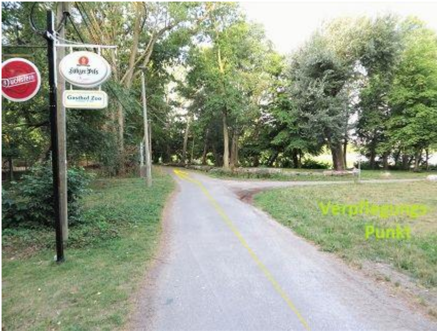
„Gasthof Zoo“ am Hexenberg