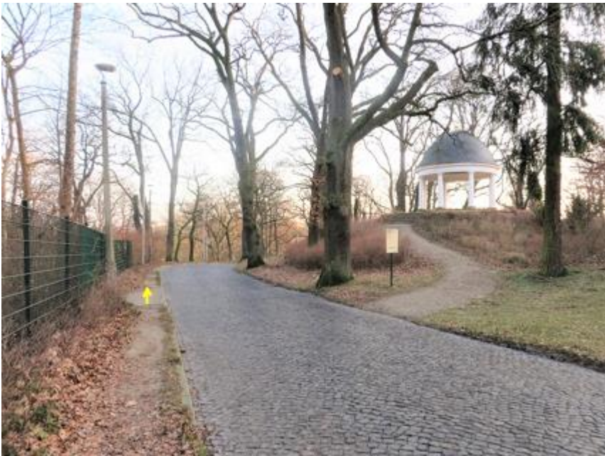
Blick auf Jugendtempel