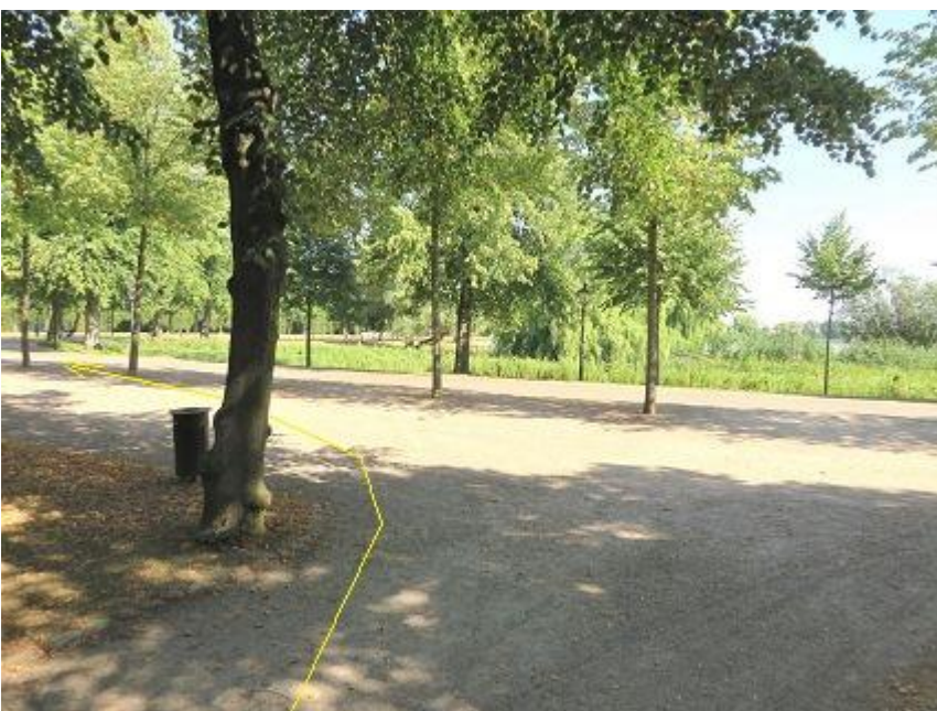
Ende Birkenweg Einbiegung auf Lennéstraße