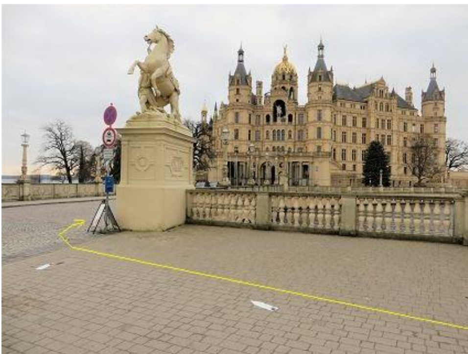
Brücke zur Schlossinsel