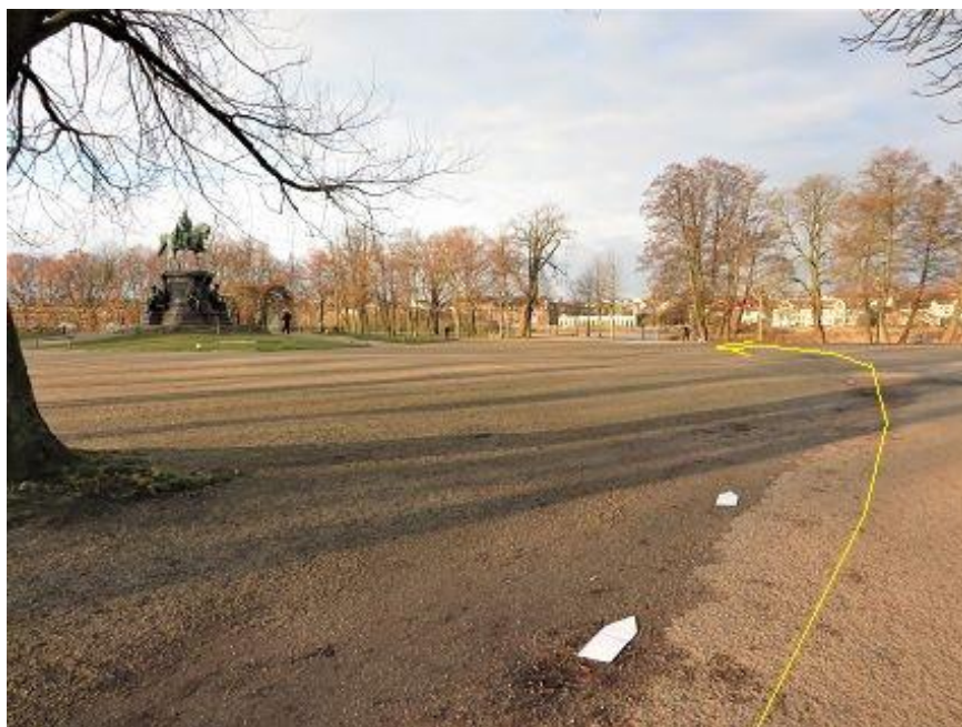
Reiterstandbild: Herzog Friedrich Franz II.