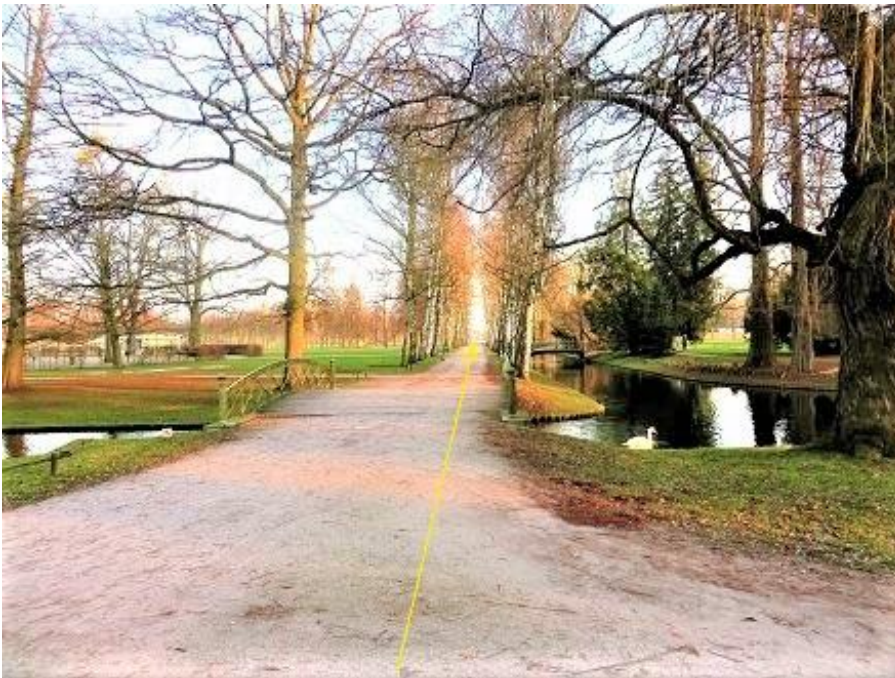
Brücke über Kreuzkanal zum Birkenweg