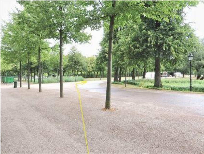
Lennéstraße - Schlossgarten