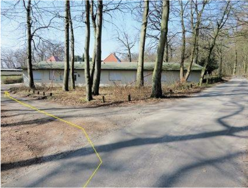
Abzweig vom „Waldschulweg“ zum unteren „Waldschulweg“ (bebaut)