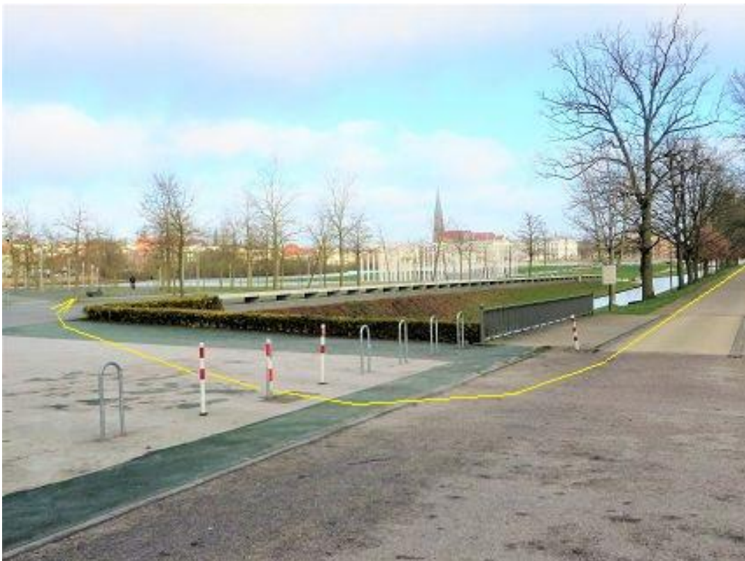
Burgseestraße – Bertha-Klingberg-Platz