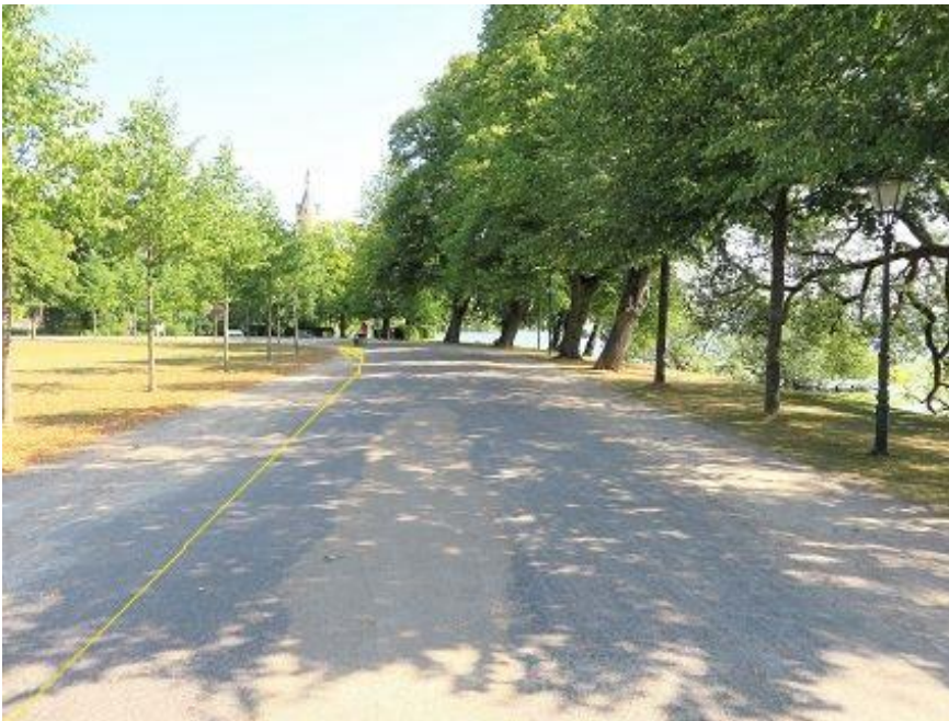
Lennéstraße - Schlossgarten