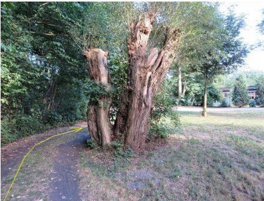
Rastplatz-Dreieck bei Zoogaststätte